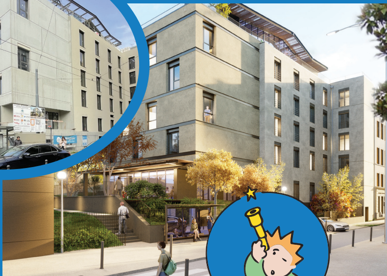
Projet de la Maison du Petit Monde Croix-Rousse