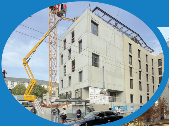
Photo des travaux de construction de la Maison Décembre 2024